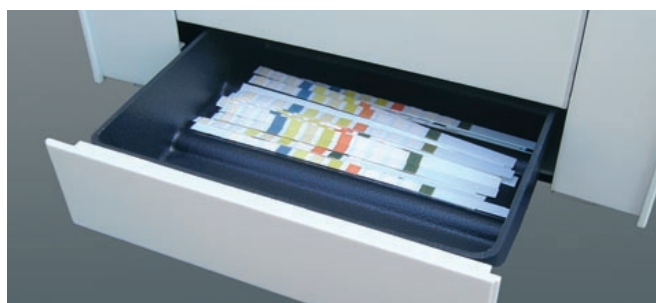
Cajón de desechos para eliminación higiénica de las tiras usadas.