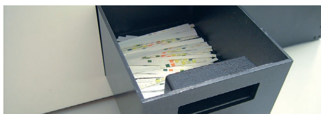
Cajón de desechos para la eliminación higiénica de las tiras utilizadas.