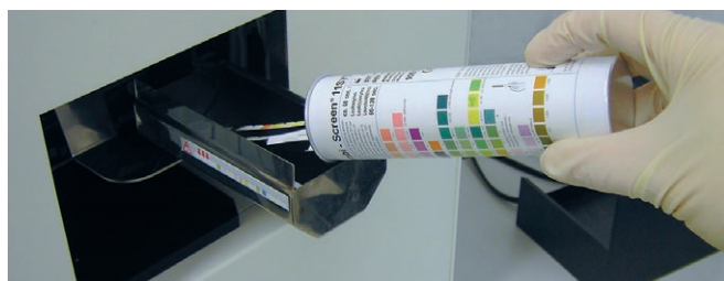
Contenedor interno para 150 tiras reactivas